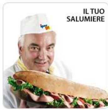
Dal salumiere copro