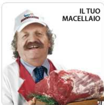
Dal macellaio compro