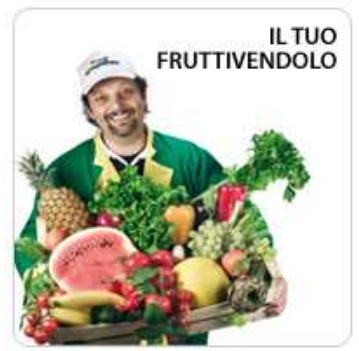
Dal fruttivendolo compro