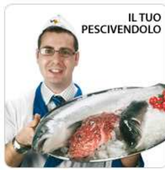
Dal pescivendolo compro